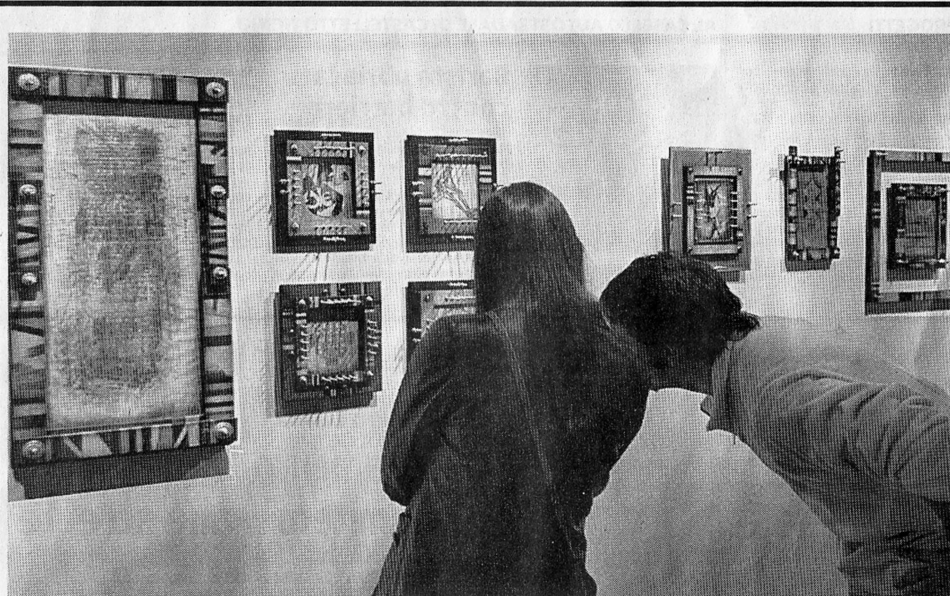
Alcune delle straordinarie opere di Fausto Pagliano: come antiche miniature in cui entra prepotente ma quasi impercettibile l'uso del computer