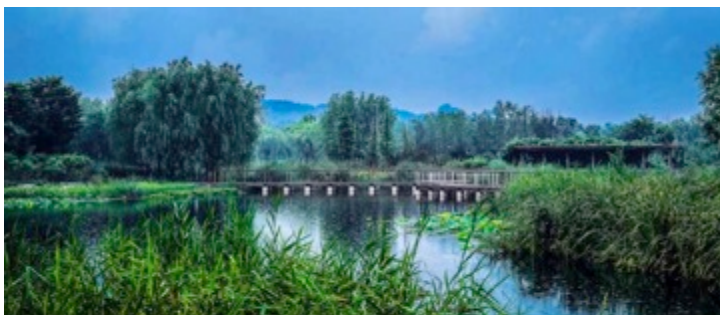
JIAHE RIVER COUNTRY PARK IN RESPONSE TO URBAN FLOOD RISK BEIJING FORESTRY UNIVERSITY from China

Il Museo del Paesaggio di Verbania ospita, dal 17 novembre 2018 al 6 gennaio 2019, una mostra multimediale che raccoglie tutti i progetti presentati in concorso alla 10ma edizione della Biennale Internazionale del Paesaggio di Barcellona.