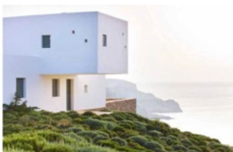
LANDSCAPES OF CONVICTION 2016/2017 From Geneva

By Sabrina Rezza | 28 novembre 2018 | Fiere ed eventi