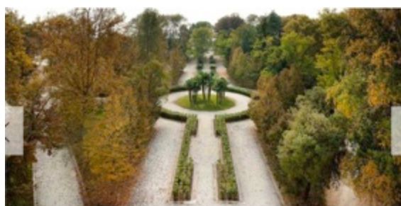
SACCIA SESSOLA ISLAND OPEN SPACES AND HISTORICAL PARK PROJECT C2 STUDIO ASSOCIATI from Italy