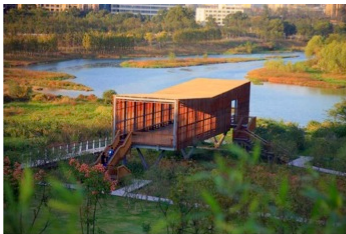
QIZHOU LUMING PARK TURENSCAPE from China

C ome sarà l'architettura green di domani? Quali le proposte più innovative e all'avanguardia del settore? Per scoprirlo il Museo del Paesaggio di Verbania ospita, dal 17 novembre 2018 al 6 gennaio, una mostra multimediale che raccoglie tutti i progetti presentati in concorso alla Biennale Internazionale del Paesaggio di Barcellona . Il tema scelto per questa decima edizione è " Performative Nature ": progettare il paesaggio diventa chiave di lettura e strumento di azione per affrontare le grandi sfide della società contemporanea. Nella capitale catalana, in occasione della Biennale, si è tenuto anche un importante simposio, che si è svolto dal 26 al 29 settembre: una tre giorni che ha chiamato a raccolta architetti, professionisti, accademici e studenti con l'obiettivo per fare il punto sullo stato dell'arte in una prospettiva davvero globale. Il percorso espositivo si dipana ora tra le sale del Museo attraverso 6 tappe di scoperta dei progetti visibili attraverso slideshow.