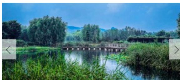
JIANHE RIVER COUNTRY PARK IN RESPONSE TO URBAN FLOOD RISK BEIJING FORESTRY UNIVERSITY from China