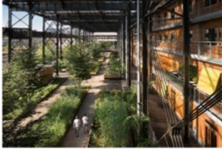
VALLEY PALACE, ROYAL LINDENHURST GARDEN 2012-16 ARCHITECTS ET: URBANFORM (L) LANDSCAPES AND URBAN PLANNING Ryan France