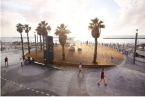
TEL AVIV'S CENTRAL PROMENADE RENOVAL 2014-15 MARCUS AND PARTNERS ARCHITECTS Ryan Israel