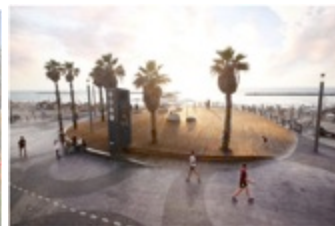
THE NORTH CENTRAL PERFORMANCE SQUARE THE NORTH CENTRAL PERFORMANCE SQUARE THE NORTH CENTRAL PERFORMANCE SQUARE