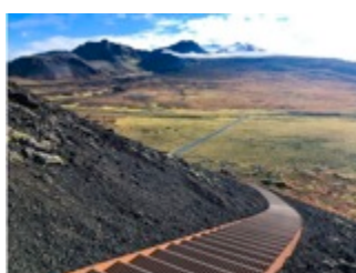
LUMA PARK EMERGENCY RAINFALL LUMA PARK EMERGENCY RAINFALL LUMA PARK EMERGENCY RAINFALL