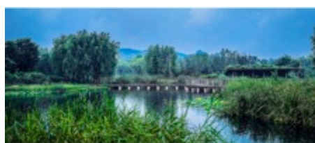
JUMEI RIVER COUNTRY PARK IN RESPONSE TO URBAN FLOOD RISK JUMEI RIVER COUNTRY PARK IN RESPONSE TO URBAN FLOOD RISK JUMEI RIVER COUNTRY PARK IN RESPONSE TO URBAN FLOOD RISK