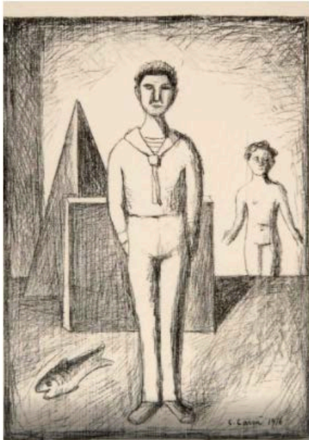
Carlo Carrà, Mio figlio , 1916-1949