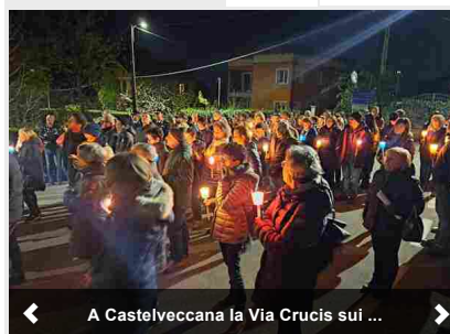
A Castelvecchio la Via Crucis sui ...