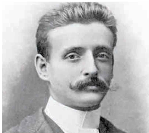
Il pittore ed esploratore Guido Boggiani. A lui è dedicata una mostra al Museo del Paesaggio